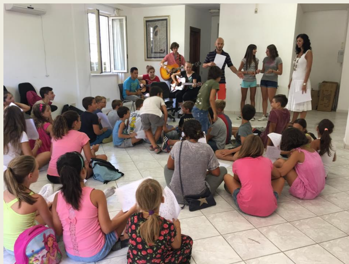
(Momenti ricreativi all'Oratorio)

Coloro che prenotano la sala, siano esse famiglie o gruppi di altro genere devono obbligatoriamente garantire la presenza di un responsabile maggiorenne, che risponda del comportamento del gruppo e dei singoli componenti durante tutto il tempo di utilizzo della sala. Gli stessi sono direttamente responsabili della gestione e dell'attività svolta dal gruppo. Queste persone si assumono a norma di legge, la responsabilità civile e penale dei danni arrecati a terzi e di quanto potrà comunque verificarsi nei locali, durante la permanenza e degli obblighi da rispettare in base al presente regolamento. Al termine dell'evento nel limite delle possibilità del gestore si verificherà in collaborazione con il Responsabile (Parroco o persona delegata dal Parroco), lo stato dei materiali.